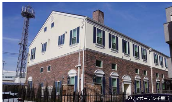
プリマガーデン千里丘