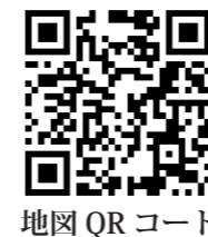
地図 QR コード