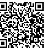
申込 QR コード